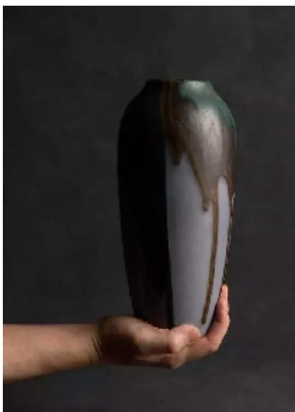
Vase, Léon Pointu, 1925/30

L'enseignement et la transmission occupent une place importante dans sa pratique de la céramique. Elle enseigne le tournage depuis 2021 à l'atelier Scalabre Mercier et travaille auprès de Grégoire Scalabre en tant qu'assistante dans la création d'œuvres d'art. Sa pédagogie est axée sur l'apprentissage des gestes et la compréhension de la matière. Elle vous accompagnera tout au long de cette formation dans l'apprentissage solide des bases du tournage.