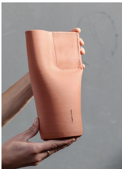
Carafe Fresh, 2021