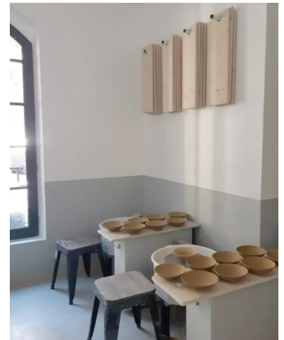
La Caserne des Minimes